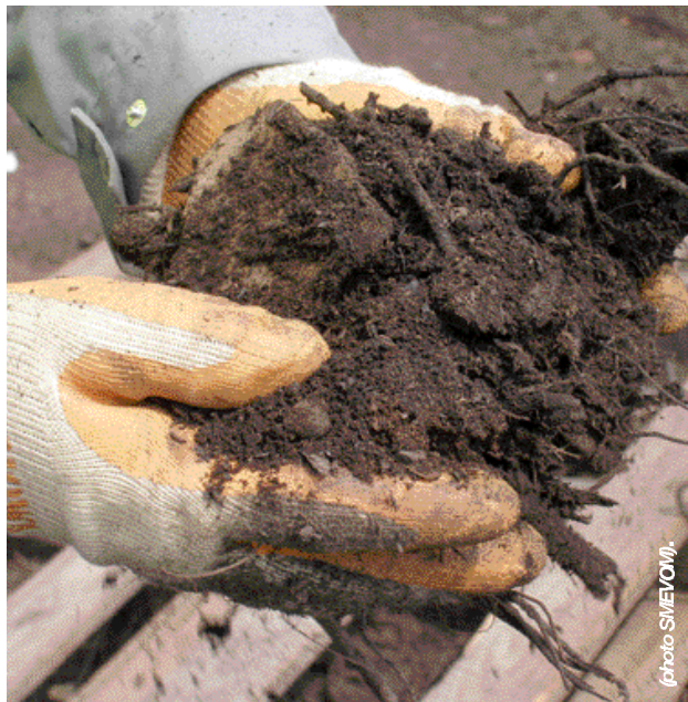
La valorisation de la fraction fermentescible des ordures ménagères est un des grands chantiers à mener par le nouvel exécutif du SMEVOM.

L'étude d'optimisation en cours a permis d'identifier des leviers qui auront des effets bénéfiques pour les collectivités