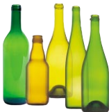
Verre de couleur