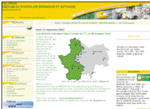
Le site www.smevom.fr constitue le portail du syndicat en lien avec tous les acteurs nationaux et locaux des déchets.

Le moteur de recherche présent sur la page d'accueil permet d'accéder directement à un article grâce à un mot-clef, sans passer par les rubriques. Cette fonctionnalité est très utile pour une recherche ciblée, très précise.